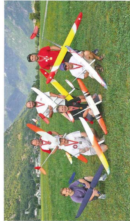
Die Elektroflieger – eine kleine, eingeschworene Gemeinschaft von Spezialisten.

Ein herzliches Dankeschön! Die Organisation des gesamten Wettbewerbsgeschehens bis hin zu Schweizer Meisterschaften und der Selektion von Nationalmannschaften ist mit einigem Aufwand verbunden. Der Vorstand des SMV dankt allen Mitstreitern in den Fachkommissionen des SMV und innerhalb der Regionalen Modellflugverbände, die den Modellflugsport mit ihren ehrenamtlichen Engagements unterstützen. Die grossen internationalen Erfolge einiger Schweizer Piloten und Teams wären ohne ein funktionierendes nationales Wettbewerbs- und Selektionswesen gar nicht erst möglich.