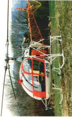
Scale Helikopter – Kunst kommt von Können.